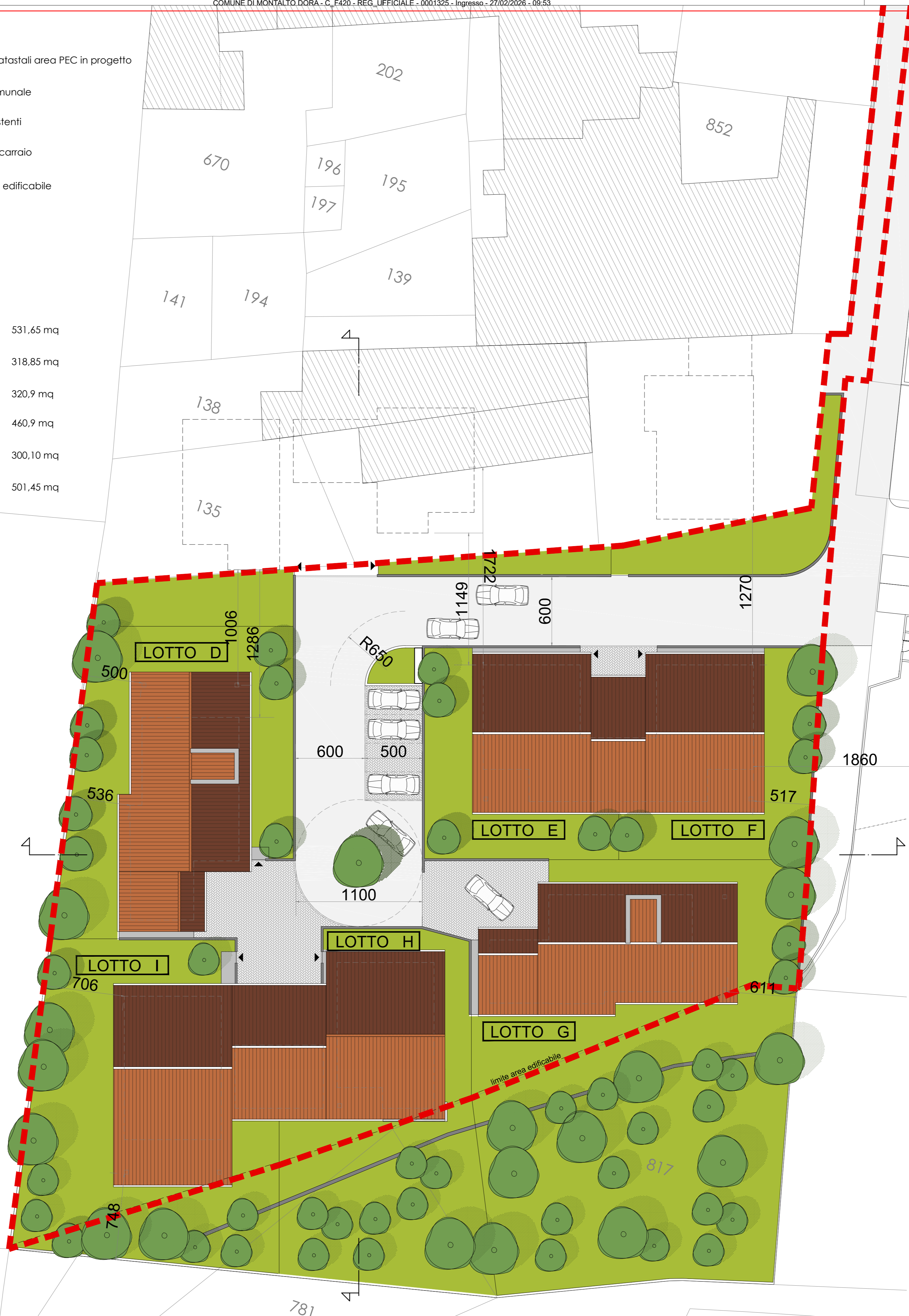
MASTERPLAN - Scala 1:200